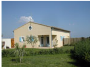
Mas des Cygnes

Twee vakantiehuisjes in Aigues Mortes (Camargue) vlakbij zee.