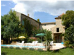
Domaine de Bercon

Drie provençaalse woningen in een groot landhuis omgeven door wijngaarden in Bagnols-sur-Cèze.